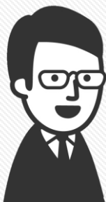
ドライバーさん (運転手ボランティア)